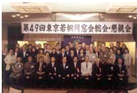
第19回東京若桐同窓会総会・懇親会

りたく、会長としての任務は、会員の増加と財政の安定を掲げ更に、平成20年は母校創立90周年、東京若桐同窓会50周年の佳節を迎え更なる発展を懇願する。と新執行部の行動力と実行を確約しました。